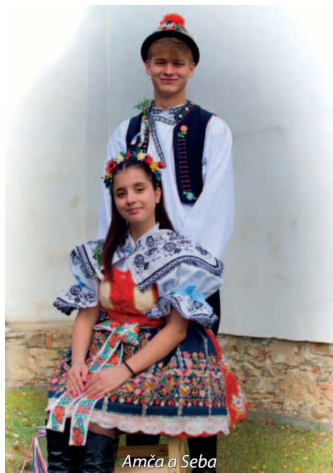
Amča a Seba